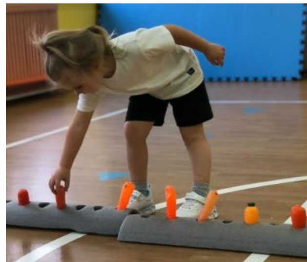
Тематические сюжетные занятия