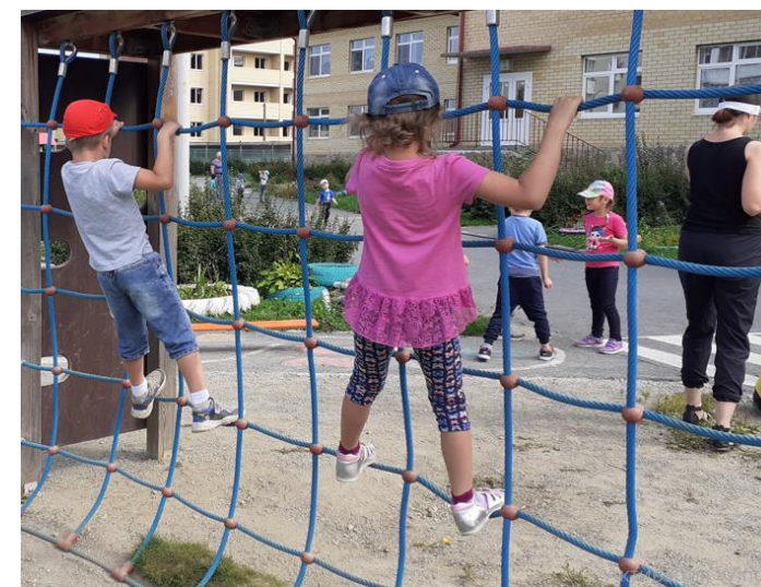
С элементами Фрироупа