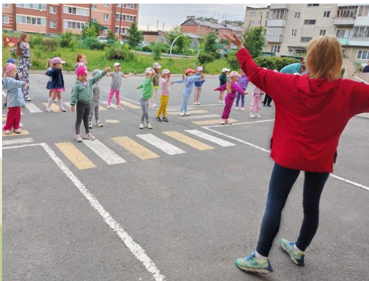
Зарядка на свежем воздухе