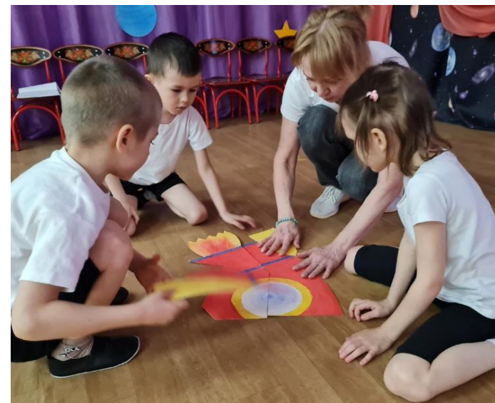
С элементами конструирования