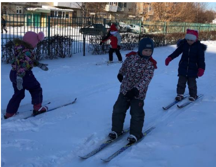
Ходьба на лыжах