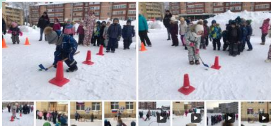
Открытие Олимпиады -2022г