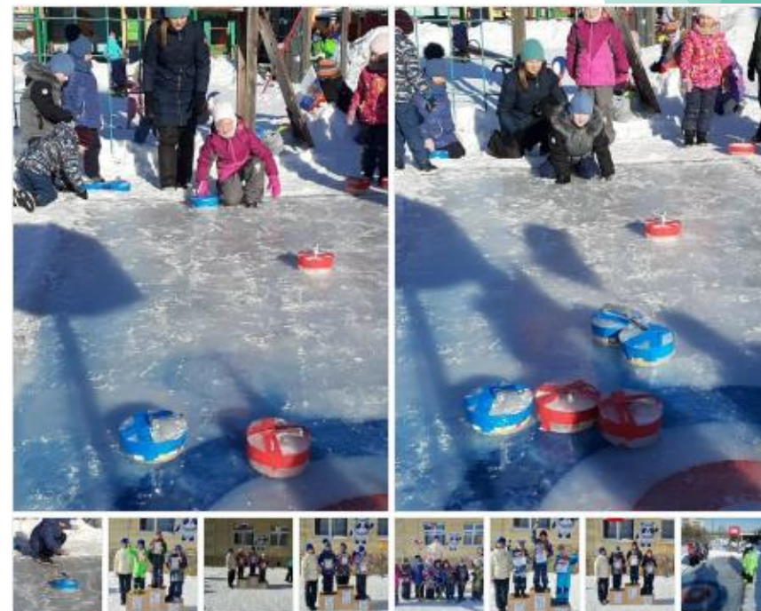
Четвертый и заключительный день Олимпиады в детском саду