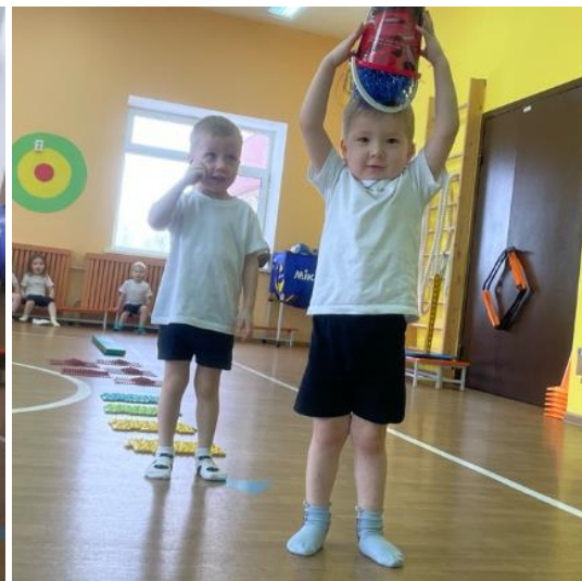
Обучающие гигиене занятия