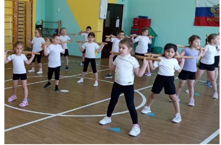
Профилактика плоскостопия и закаливающие процедуры Профилактика осанки