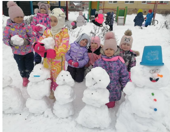
Игры и занятия на свежем воздухе