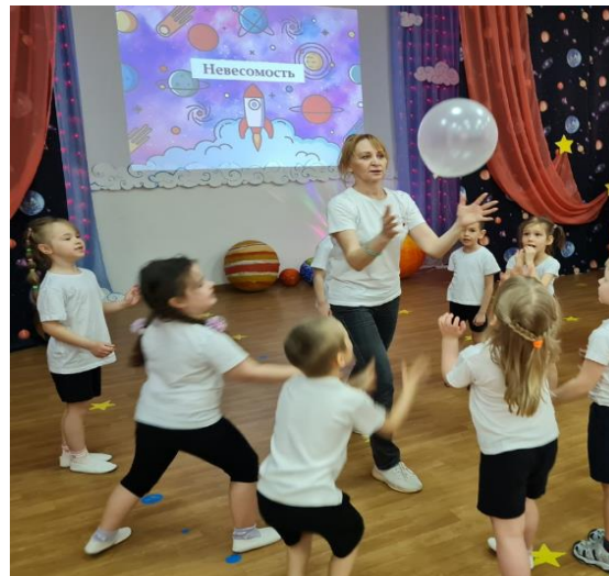
Игры с любимыми подручными средствами