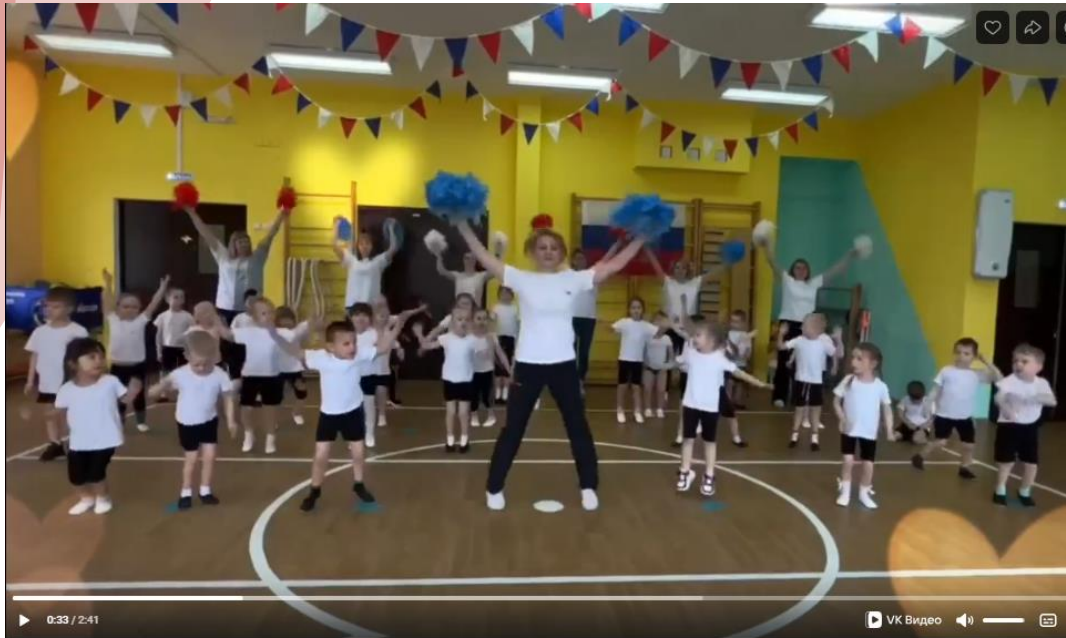
Видео от "Дом культуры Верхнее Дуброво"