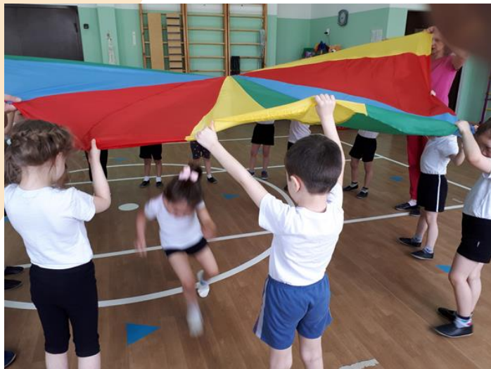
Игры с парашютом