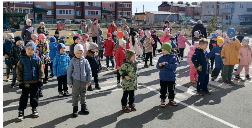
Зарядка на свежем воздухе с родителями