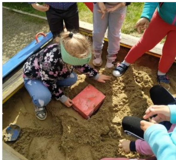
С элементами Геокешинга