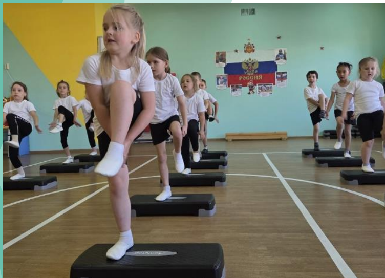
Детский фитнес Степ-аэробика