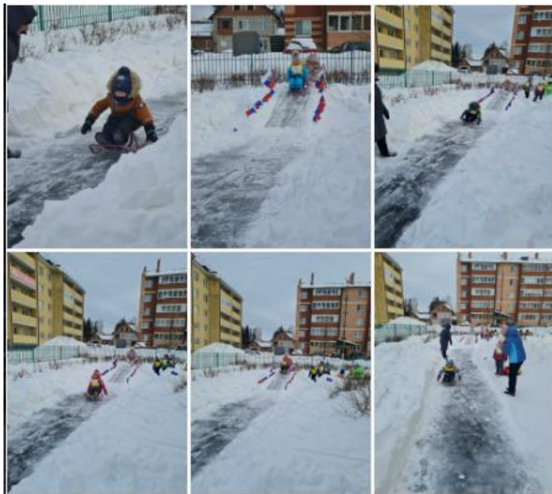
Третий день Олимпиады - 2022г