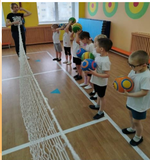
Занятия с элементами спортивных игр