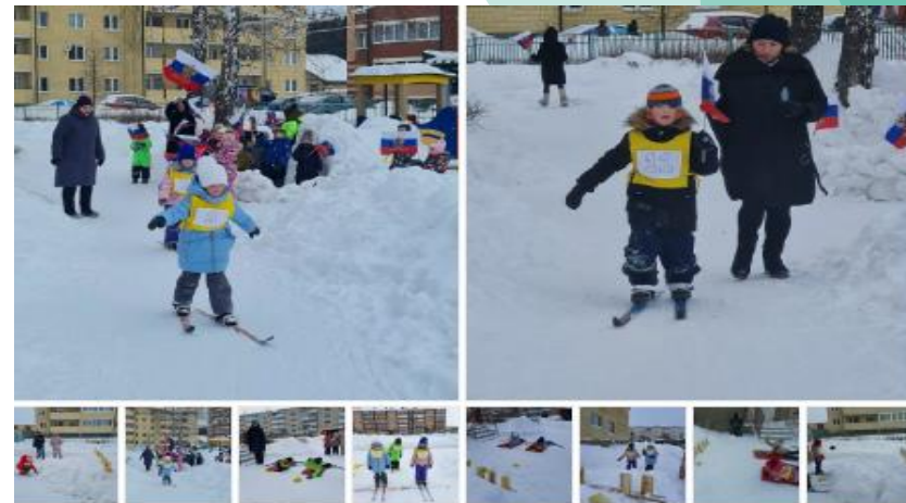
Второй день Олимпиады-2022