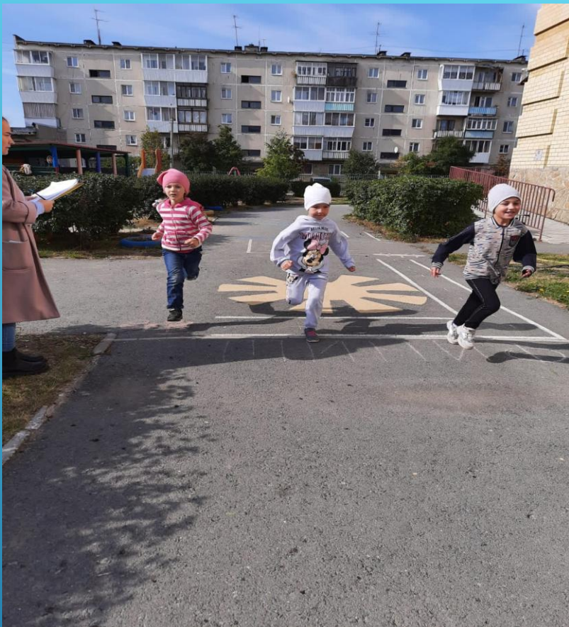
► Кросс нации 2022г.