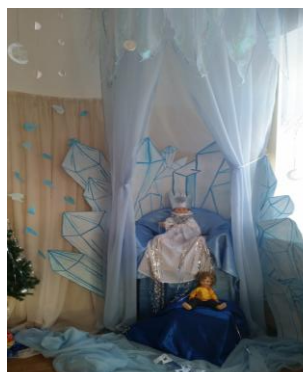
гр. №6 «Снежная королева»