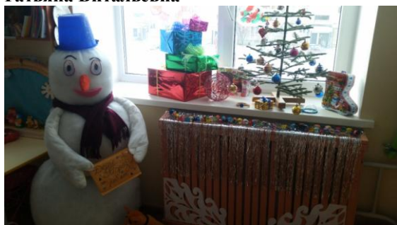
гр.№2 м/ф «Снеговик – почтовик»