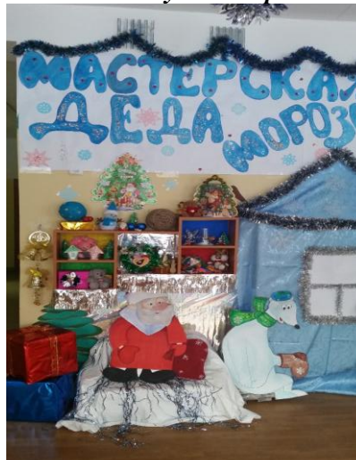
гр. №1 м/ф «Дед Мороз и лето!»