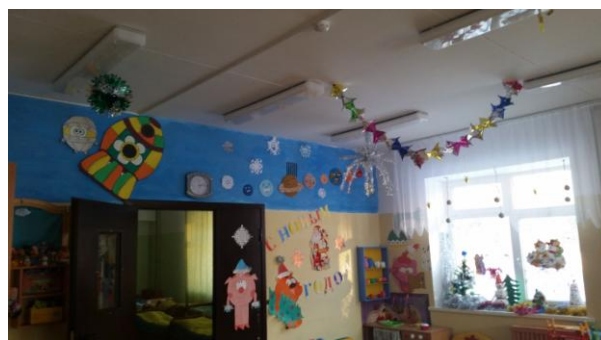
гр.№4 «Новый год у Снежариков»