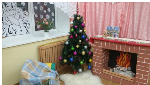
гр. №7 по страницам сказки «Снежная королева»