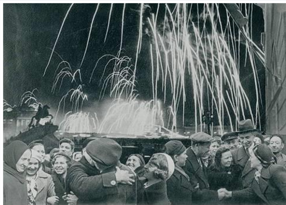
-Великая победа одержана советскими войсками под Ленинградом:

Победе радовалась вся страна, но эта радость была со слезами на глазах, так как в каждой семье, в каждом доме кто-то погиб на этой страшной войне.