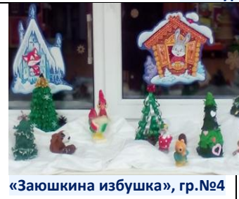
«Заюшкина избушка», гр.№4