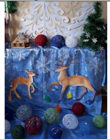
«Серебряное копытце», гр.№2