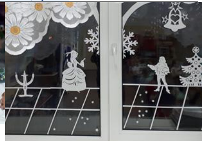
«Золушка на балу», гр.№5